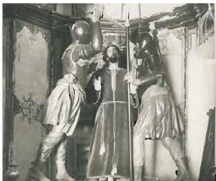
Prendimiento de Salzillo. Destruído en 1936

Desde esta tribuna y gracias a los que componemos el Cabildo Superior de Cofradías Pasionarias de la Ciudad de Mula, me dirijo a todos vosotros, muleños y muleñas, visitantes que en estos días nos acompañáis en la Semana de Pasión, especialmente a todos los miembros de esta Venerable Hermandad, desde esta nueva publicación que tiene como objetivo, ahondar si cabe, en todos los aspectos que conforman el día a día de las Cofradías y Hermandades, así como, de todo lo relacionado con nuestra querida Semana Santa.