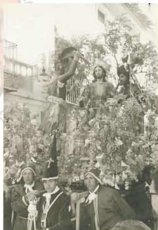
Mañana de Jueves Santo de 1963, por haberse suspendido la procesión de Miércoles Santo por la lluvia.