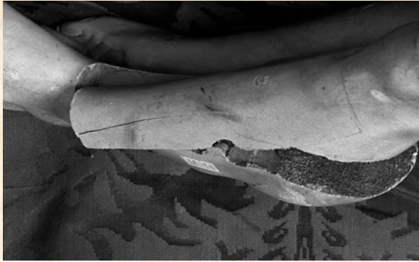
09.- Detalle de la fotografía del Cristo yacente, donde al invertir la foto se puede leer con claridad la pegatina que se le puso a la imagen para saber de dónde procedía, pudiéndose ver con claridad que pone "Mula".

de 35 cm; una Virgen de la Soledad anónima, de 62 cm; un San Cristóbal, anónimo, de 66 cm; un Cristo, anónimo, de 75 cm; un Niño, anónimo de 30 cm; otro atribuido a Pedro de Mena, de 28 cm; tres angelitos, igualmente anónimos, de 38, 28 y 35 cm; tres querubines también anónimos de 8 y 9 cm; un crucifijo, anónimo, de 69 y 33 cm; una cabeza de un Santo, también anónimo, de 10 cm; un Santo de terracota, anónimo, de 16 cm; un crucifijo de marfil de 38 y 16 cm; otro de iguales características de 30 y 17 cm; un Calvario atribuido a la escuela Italiana, de 75 x 47 cm; otro crucifijo de marfil, que se indica que es románico, de 150 y 95 cm; y un Niño de marfil, igualmente anónimo, de 48 cm.