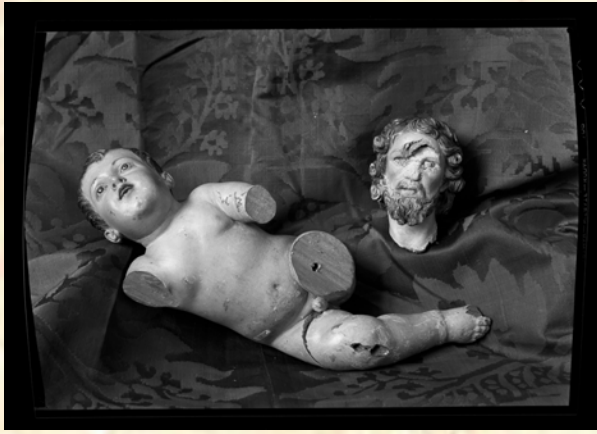
7.- FOT_NEG-083_022. Otro de los ángeles y una cabeza mutilada que se trajeron de Mula y que fueron fotografiados por el Servicio de Defensa del Patrimonio Artístico Nacional antes de devolverlos.

Virgen de las Angustias, de la iglesia de Santo Domingo”, de Mula.