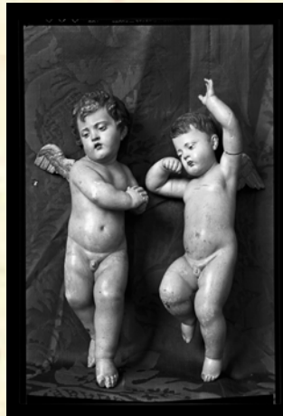
6.- FOT_NEG-083_020. Dos de los tres ángeles que se trajeron de Mula y que fueron fotografiados por el Servicio de Defensa del Patrimonio Artístico Nacional, quien se encargaría de devolver el patrimonio incautado a sus respectivos propietarios.

Museo de Bellas Artes de Murcia, restaurado en 2009 5 , y firmado igualmente con grafito en la base, apreciable al levantar la figura del Niño. Lo que hacen un total de tres obras auténticas e indubitadas de Marcos Laborda. Tres esculturas que nos sirven, junto con la efigie de San Pascual bailón de Caravaca (firmada en el exterior) para estudiar al escultor caravaqueño. Pudiendo apreciar tras su análisis que las tres presentan una misma serie de acabados, de grafías de decoraciones, que claramente identifican al artifice que las llevó a cabo. Siendo quizás el caligráfico y sutil acabado que Marcos Laborda