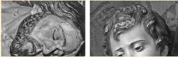
4.- Comparativa de los acabados que presentan en sus cabelleras el Cristo de la Virgen de las Angustias de Cehegín con uno de los tres ángeles que se conservaron procedentes de Mula.

ya que al realizar un segundo orificio en la base de la espalda -aprovechando otro deterioro existente en la madera- se descubrió que en la base de la caja interna, el escultor había dejado un documento manuscrito (de un tamaño aproximado de medio folio), adherido a las paredes de madera mediante un punto de adhesivo. Un papel que había sido introducido en el corazón de la obra, por el propio escultor, durante la fase de ensamblado de las maderas. Un documento cuyo contenido aclararía cualquier duda al respecto de la autoría de la obra, pues en él aparecían reflejados todos los datos del encargo. Descartándose que esta Virgen de las Angustias fuese la que aparece en el Catálogo de obras de Roque López, dado que no encajaba ni con el año, ni tampoco con quien encargó la obra. 2 Debiéndose tratar de una segunda efigie que se hizo para Cehegín, en este caso de mano del escultor caravaqueño Marcos Laborda. Un hallazgo muy valioso, pues ponía sobre la mesa una obra auténtica de este escultor. Permittiéndonos a los investigadores conocer, con total seguridad, cómo trabajaba -tanto interior como exteriormente- aquel escultor procedente de la ciudad de la Cruz. Unos años después, concretamente en 2008, un anónimo busto de Dolorosa, en principio atribuido a Salzillo, volvió a sorprender, al encontrarse