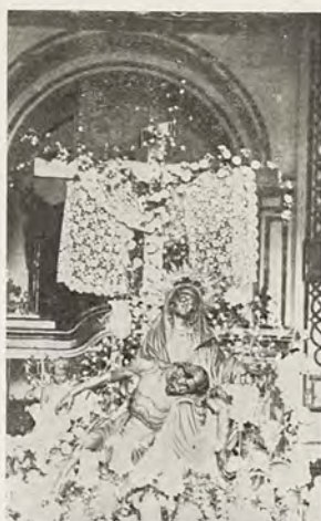
2.- Detalle de la fotografía que aparece de la desaparecida Virgen de las Angustias de Mula, obra de Marcos Laborda.

Una intervención que, a priori se aventuraba compleja, pues eran varios los estratos de repolicromía que ocultaban la película pictórica original. Desconociéndose en aquellos momentos la monumental sorpresa que esta obra nos tenía deparada a los restauradores.