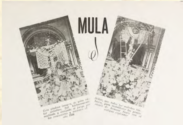
1.- Recorte de la página 97 de la revista Fiestas de Primavera 1947, donde aparecen dos obras que formaban parte de la Semana Santa de Mula, destruidas en 1936.