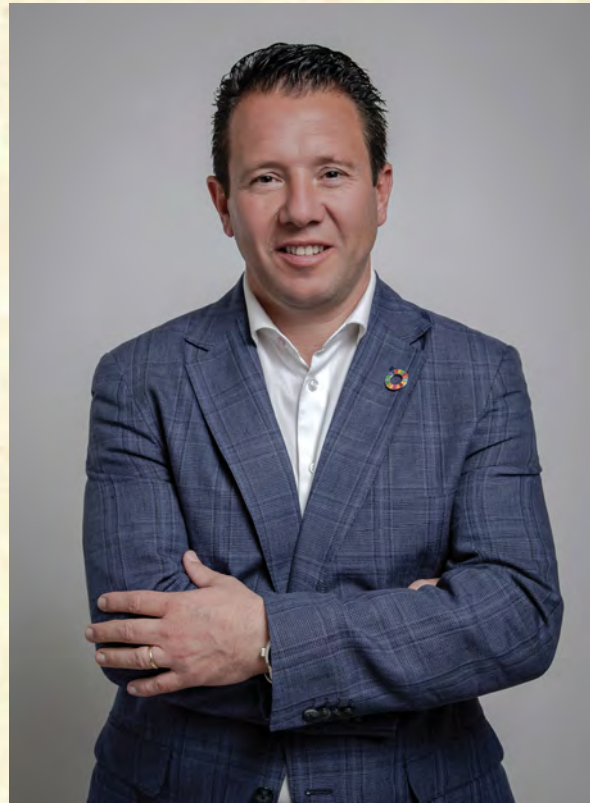
Juan Jesús Moreno García Alcalde de Mula

Cuando la primavera ya asoma en nuestro paisaje de huerta, me complacer dirigir un saludo al Cabildo Superior de Cofradías Pasionarias de Mula, a todos los hermanos y hermanas y, en general, a todos los muleños y muleñas que esperan con entusiasmo y fervor, después de este largo episodio pandémico, el tan ansiado recuento con una de las más significativas tradiciones de nuestra bella ciudad, nuestra hermosa y querida Semana Santa, única en la Región de Murcia por la perfecta comunión entre devoción, tradición, cultura y patrimonio.