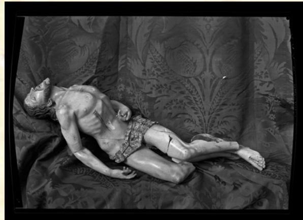
8. FOT_NEG-083_023. Un Cristo yacente que también se trajo de Mula y que fue fotografiado por el Servicio de Defensa del Patrimonio Artístico Nacional antes de devolverlo.

Lo poco que se salvó tras el paso de aquellos fanáticos fue recogido y puesto a salvo por la Junta Delegada del Tesoro Artístico de Murcia, 13 una institución, creada por la República, con el único fin de salvaguardar las obras de arte que aún quedaban intactas, recogiendo igualmente todo lo que había sobrevivido al ataque de los exaltados. Recogiendo obras por toda la Provincia y trasladándolas hasta el antiguo Museo Provincial (hoy Museo de Bellas Artes), donde fueron depositadas y custodiadas entre 1936 y 1939. Obras que, nada más entrar en el depósito eran dadas de alta en un registro general, apuntándose su fecha de entrada, su procedencia exacta (si es que se sabía), así como sus dimensiones. Siendo en este cuaderno donde encontramos,