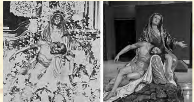
3.- Comparativa entre la Virgen de las Angustias de Mula y la documentada Virgen de las Angustias de Cehegín, apreciándose que son exactamente iguales.

No siendo hasta un segundo examen, al girar la sonda para mirar otras zonas, cuando se descubrió una segunda inscripción -muy cerca de la anterior